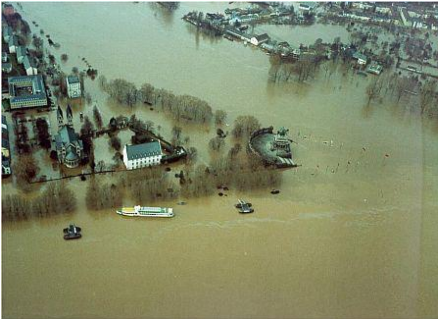
Deutsches Eck im Hochwasser Dezember 1993